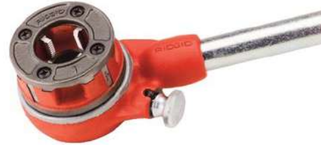
Резьбонарезной комплект RIDGID 11-R, BSPT, 1/2"-1 1/4"