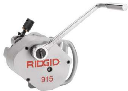
Желобонакатчик ручной RIDGID модели 915