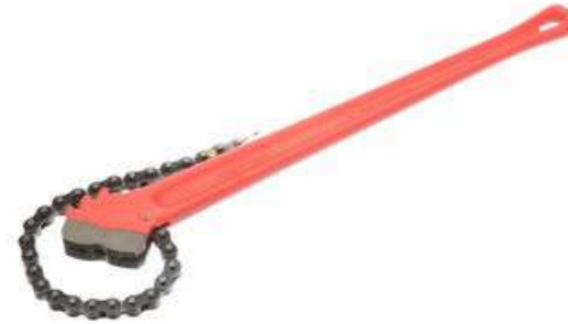
Цепной ключ для больших нагрузок RIDGID C-24