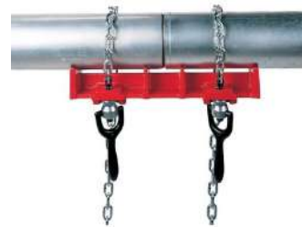
Тиски RIDGID для сварки прямых труб