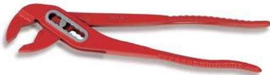
Трубные клещи RIDGID 240