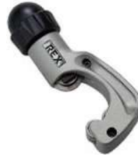
Труборез для медных и стальных труб REX N30