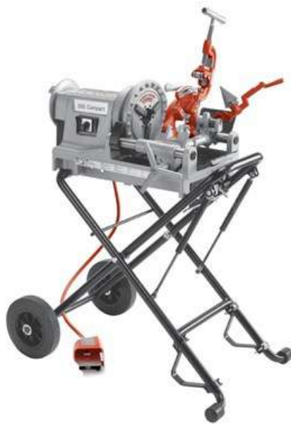
Станок резьбонарезной RIDGID 300 Compact