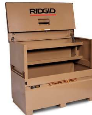
Контейнеры RIDGID для профессионального инструмента