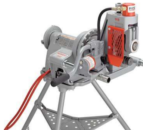
Гидравлический желобонакатчик RIDGID модели 918