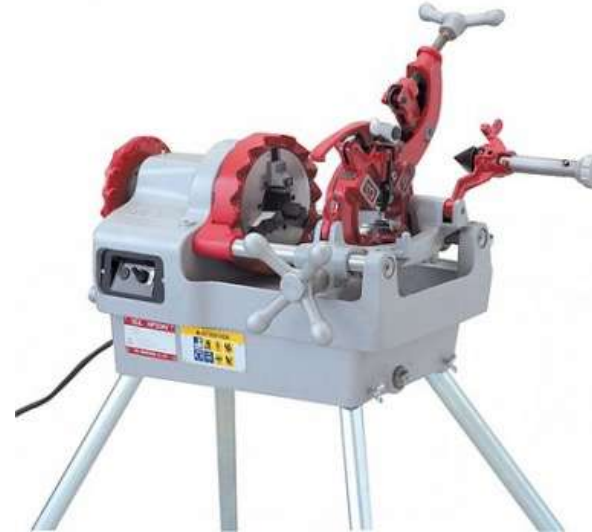
Резьбонарезной станок REX NP50