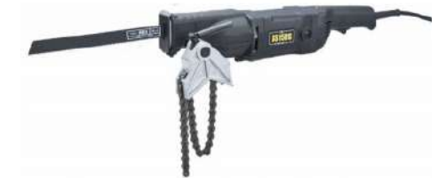
Пи́ла сабельная электрическая REX HYPER SAW XS150S