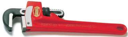
Ключ RIDGID Raprench 10"