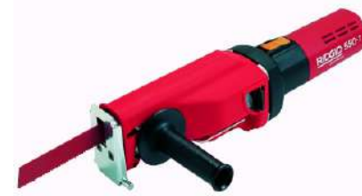
Пи́ла сабельная RIDGID 550-1