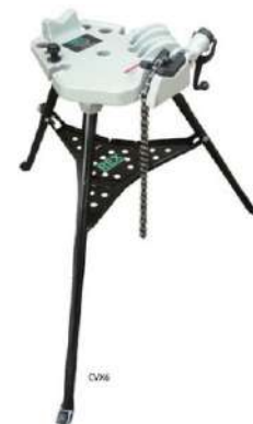
Тиски цепные на мобильной подставке REX CVX6