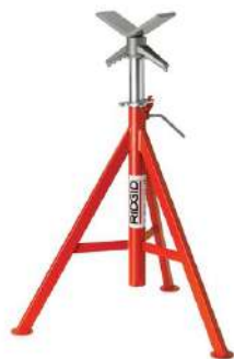
Опора высокая для труб с V-образной головкой RIDGID VJ-99