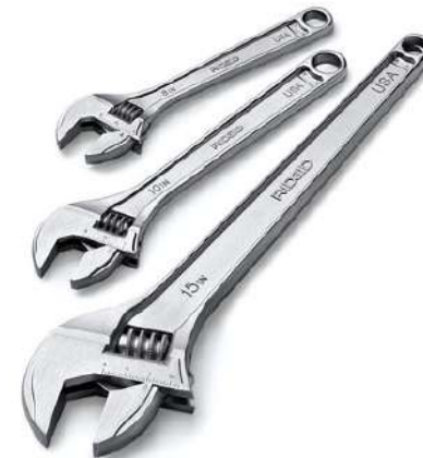
Разводные ключи RIDGID