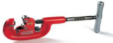
Труборезы RIDGID для больших нагрузок