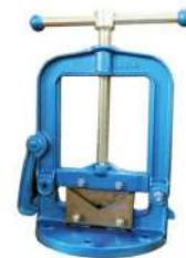
Тиски откидные трубные настольные REX V3 1/8" – 4"