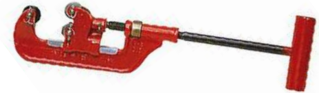
Труборез ручной для стальных труб REX C Series