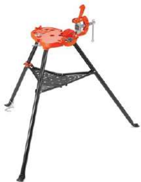
Тиски для труб переносные RIDGID TRISTAND®