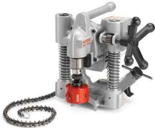
Станок для вырезания отверстий RIDGID HC300 3" (76 мм), 230 В