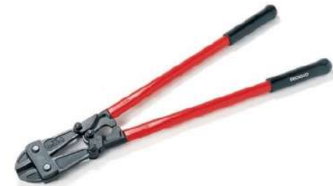
Арматурные ножницы RIDGID