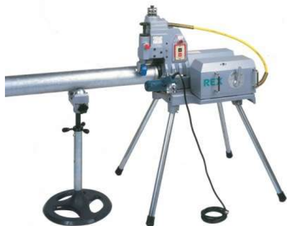
Электро-гидравлическое устройство для накатки желобков REX RG-150