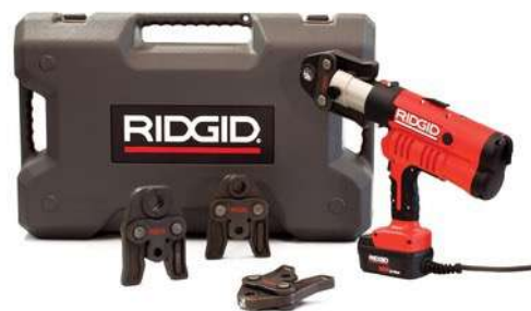
Пресс-инструмент RIDGID RP 340-C с питанием от сети