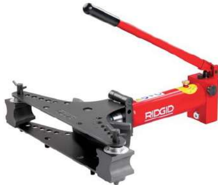
НВ382 Гидравлический трубогиб RIDGID с закрытой рамой 3/8"-2"