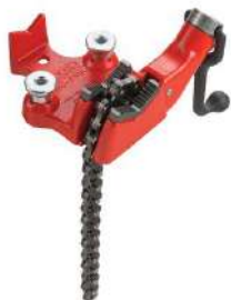
Тиски цепные верстачные RIDGID