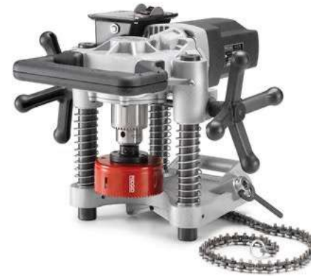
Станок для вырезания отверстий RIDGID HC450