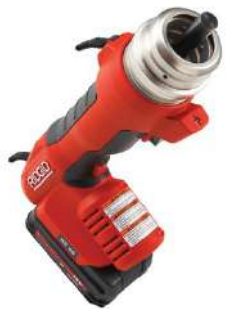
Многофункциональный электроинструмент RIDGID RE 60