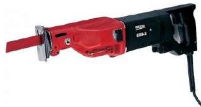
Пи́ла сабельная RIDGID 530-2