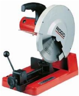
Сухопильная пила RIDGID 590 L