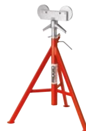
Опоры для труб с роликовыми головками