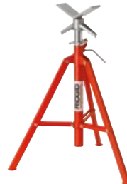
Опоры для труб с V-образными головками