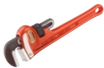
Прямые ключи для больших нагрузок