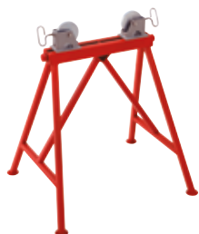
Регулируемая опора со стальными роликами