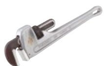
Прямые алюминиевые ключи